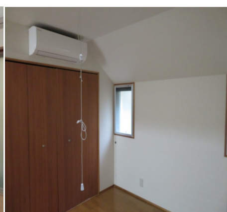
■ 図面と現況が異なる場合は現況を優先いたします。 ■ 契約成立の場合は、仲介手数料として賃料の1ヶ月分(消費税別途)をお支払いいただきます。